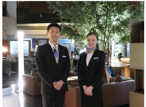
「ロビーコンシェルジュ」と「レストランコンシェルジュ」

パークホテル東京では、アートを取り入れた独自の「日本のおもてなし」を発信するコンセプトとして「日本の美意識が体感できる時空間」を掲げ、ART=空間 (Atrium) 食 (Restaurant) 旅 (Travel) のそれぞれのシーンで、日本の美意識を体感して頂くための取り組みを行っています。「3つのおもてなし」はご滞InTheそれぞれのシーンをより一層お楽しみ頂くために、2016年に設けた「アートコンシェルジュ」のほかに、「ロビーコンシェルジュ」「レストランコンシェルジュ」が加わり、ご利用目的の異なるお客様一人ひとりをもてなす新たな取り組みです。