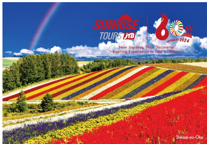
四季彩の丘(北海道美瑛町) ※イメージ