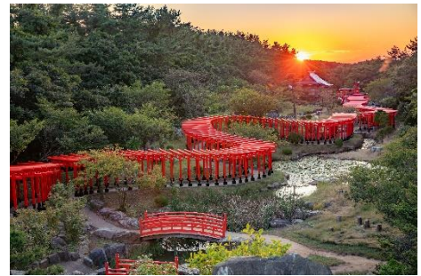
高山稲荷神社 ※イメージ

本ルートは、東北最大の都市である仙台を旅の起点とし、平泉、盛岡、角館、青森、弘前と北上しながら巡るルートです。東北エリアは各地に魅力的なコンテンツがあるものの、二次交通の課題により、外国人観光客にとっては周ることが難しいエリアとなっていました。本ルートではそれぞれの魅力を行程に組み込むことで、その課題を解決し、新たな人流を創出します。