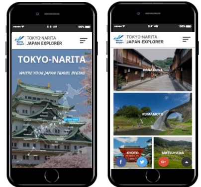
スマートフォンからの閲覧イメージ

特色：訪日されるお客様が「Tokyo」や「Japan」といったキーワードで簡単に検索できるサイト名とし、成田空港から旅行できる各観光地やアクセス情報などを紹介します。