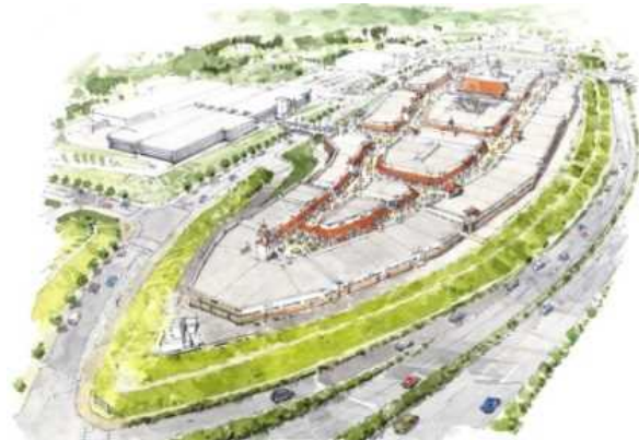
第4期増設後イメージ

鳥栖プレミアム・アウトレットは、九州最大のアウトレットにふさわしいブランドラインナップの充実を図り、国内外のお客様から、更にご愛顧いただける施設を目指してまいります。