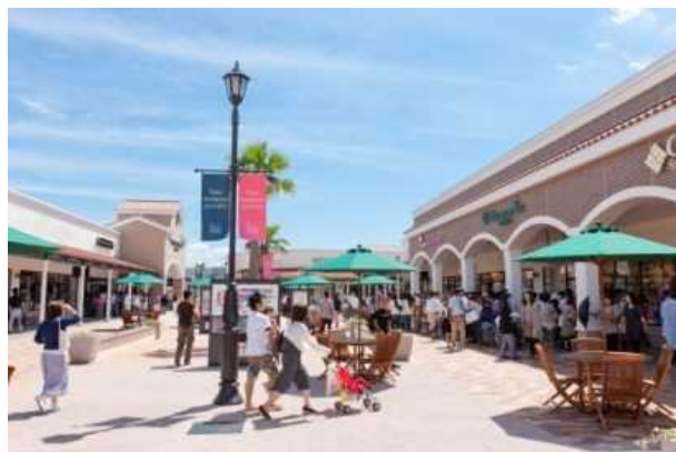
鳥栖プレミアム・アウトレット