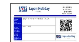
【配信されるQRコード(一例)】