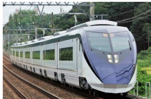
京成スカイライナー