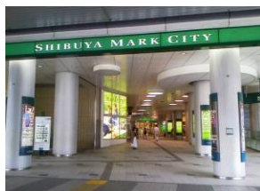
渋谷マークシティ