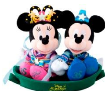
ぬいぐるみセット 5,200円

東京ディズニーランドと東京ディズニーシーでは、彦星と織姫に扮したミッキーマウスとミニーマウスが笹の船に乗り天の川を渡るロマンチックな様子をデザインしたグッズや、七夕ならではの“吹き流し”をモチーフにしたグッズを販売します。