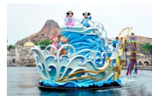
七タグリーティング

彦星と織姫をイメージしたコスチュームを身にまとったミッキーマウスやミニーマウスをはじめディズニーの仲間たちが、七夕をイメージした星や笹の装飾が施された船に乗って登場し、七夕でおなじみの曲に合わせ、夢がかなうように願いをかけながら、ゲストの皆さまにご挨拶します。