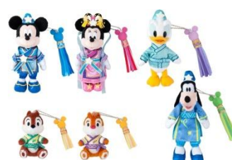
ぬいぐるみバッチ 各1,700円 ぬいぐるみバッチセット(チップとデール)2,800円