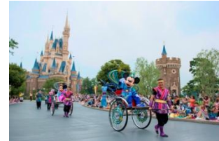
七タグリーティング

ミッキーマウスとミニーマウスが、彦星と織姫をイメージしたデザインのコスチュームに身を包み人力車に乗って登場し、ディズニーの仲間たちと一緒に七夕でおなじみの曲に合わせてグリーティングをします。