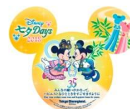
れすとらん北齋の ウィッシングカード