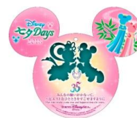
ウィッシングカード