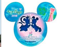
ウィッシングカード