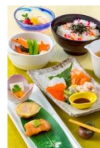
レストラン櫻のスペシャルセット(2,880円)とウィッシングカード

また、両パーク共通で彦星と織姫に扮したミッキーマウスとミニーマウスがデザインされたスーベニアカップ付きデザートや、彦星と織姫をイメージしたシェイプアイスを販売するほか、東京ディズニーシーでは、七夕らしさを感じる色合いのカクテルを販売します。