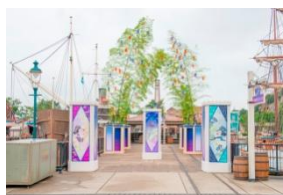
ウィッシングプレイス

アメリカンウォーターフロントのニューヨークエリアにある栈橋には、今年も“ウィッシングプレイス”が設置されます。笹などの飾りとともに、新たにミッキーマウスをかたどった吹き流しをモチーフにした装飾が追加され、キャストが配布する“ウィッシングカード”に、夢や願い事を書いて結びつけることができます。