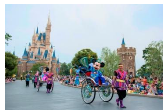
東京ディズニーランド「七夕グリーティング」

2つのパークでは、彦星と織姫をイメージしたコスチュームに身を包んだミッキーマウスとミニーマウスや、ディズニーの仲間たちが、ゲストの皆さまにご挨拶をする「七夕グリーティング」を実施します。東京ディズニーランドのパレードルートでは人力車に、東京ディズニーシーのメディテレーニアンハーバーでは船に乗って登場します。