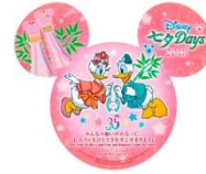
東京ディズニーシー・ホテル ミラコスタのウィッシングカード