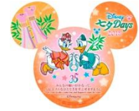
東京ディズニーランドホテル のウィッシングカード