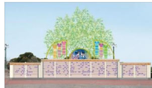
ウィッシングプレイス

シンデレラ城を見渡せるプラザテラスには、ミッキーマウスとミニーマウス、そしてドナルドダックとデイジーダックが描かれた2種類の“ウィッシングプレイス”が新たに登場。ミッキーマウスをかたどった吹き流しや笹が飾られ、七夕ならではの雰囲気を盛り上げます。ゲストは、キャストの配布する“ウィッシングカード”に夢や願い事を書いて、“ウィッシングプレイス”に結びつけることができます。