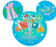
ディズニーアンバサダー ホテルのウィッシングカード

そして、ディズニーアンバサダーホテルのメダリオンメーカーには、ミッキーマウスとミニーマウスがデザインされたホテルオリジナルの“ディズニー七夕デイズ”のスーベニアメダルが登場します。