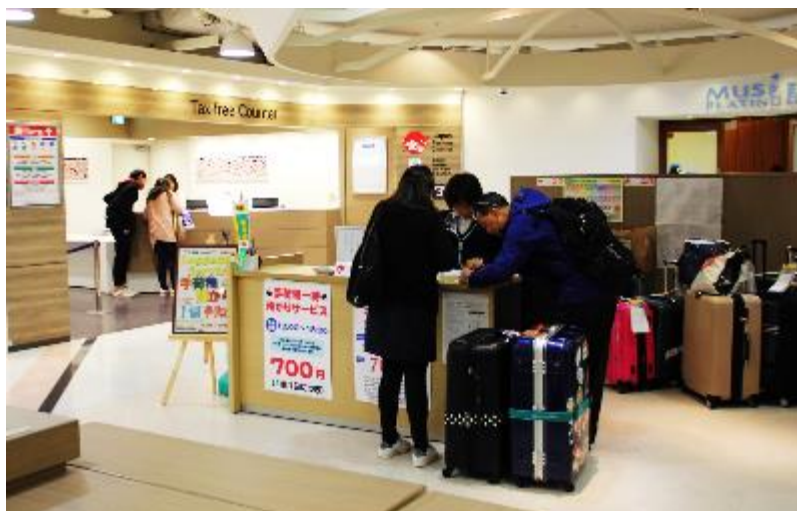
なんば CITY 地下2階 宅急便カウンター

南海電鉄とヤマト運輸は、平成28年9月から難波駅併設の商業施設「なんばCITY」地下2階で手荷物一時預かりサービスを行っています。nest 開業後も引き続き営業いたしますので、こちらもぜひご利用ください。