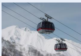
谷川岳ロープウェイ