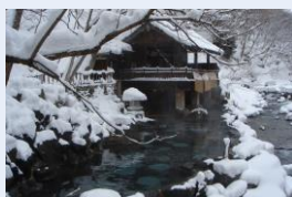
混浴露天風呂(冬の様子)