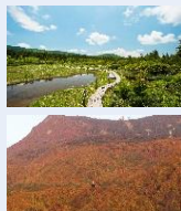
トレッキングと紅葉の様子

蔵王には、4月から11月の間だけ入れることができる大自然に囲まれた源泉掛け流しの「蔵王温泉大露天風呂」があります。溪流の横にあり、川音を楽しみながらの入浴は格別で、幻想的な時間を過ごすことができます。さらに、夏になるとトレッキングや、秋には紅葉がピークを迎えるなど、一年を通して豊かな自然を楽しむことができる観光地です。