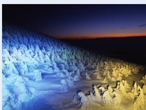
ライトアップされた樹氷