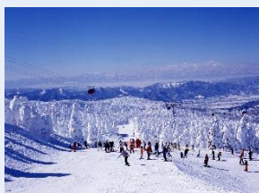
蔵王温泉スキー場

蔵王ロープウェイ URL : http://zaoropeway.co.jp/en/index.html