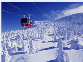
蔵王ロープウェイ