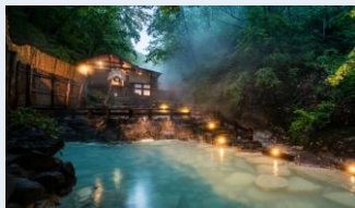
蔵王温泉大露天風呂