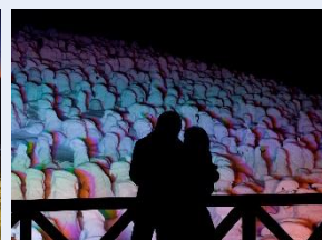
樹氷を楽しむカップル