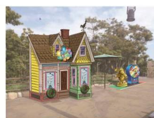
『カールじいさんの空飛ぶ家』 がテーマのゲームブース