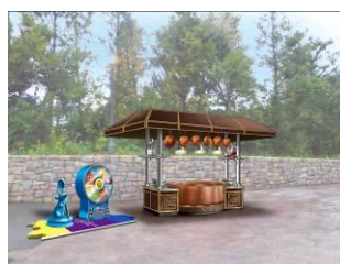
『レミーのおいしいレストラン』 がテーマのゲームブース