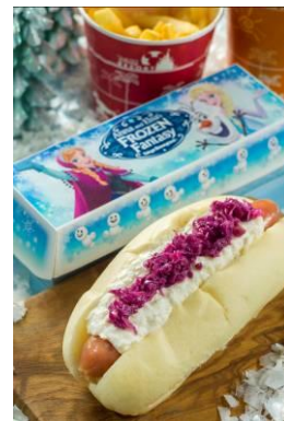
リフレッシュメントコーナー スペシャルセット 900 円

※スペシャルグッズ、スペシャルメニューの内容は、変更または売り切れとなる場合があります