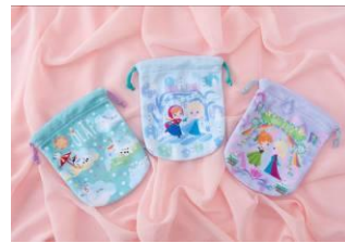
きんちゃくセット 1,600 円