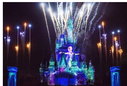
「フローズン・フォーエバー」

おなじみの数々の名場面や、誰もが一度は耳にした「レット・イット・ゴー～ありのままで～」、「生まれてはじめて」、「とびら開けて」などの名曲が響き渡り、最後は打ち上がるパイロとともに感動的なフィナーレをお楽しみいただけます。