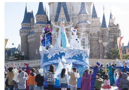
東京ディズニーランド 「アナとエルサのウィンターグリーティング」

東京ディズニーランド®では、冬のスペシャルイベント「アナとエルサのフローズンファンタジー」がファイナルを迎えます。ディズニー映画『アナと雪の女王』をテーマにしたパレード「フローズンファンタジーパレード」やグリーティングショー「アナとエルサのウィンターグリーティング」など、昨年引き続き実施するほか、今年は、映画でも印象的なエルサの氷の城のシーンを彷彿とさせるような体験型のフォトロケーションが登場し、アナやエルサになりきって写真を撮ることができます。