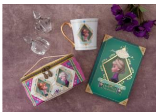
ポーチ 2,200 円 マグ 1,900 円 ノート 1,500 円