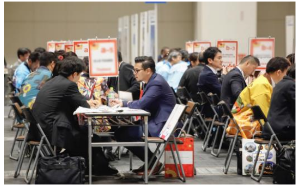
図2 商談の様子（昨年度実施時）

イベント名：「VISIT JAPAN Travel Mart 2018 -ASEAN・INDIA-」