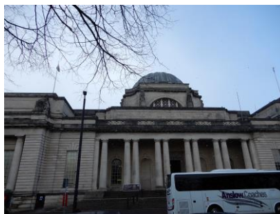
② ウェールズ国立博物館