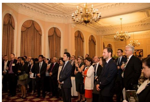
① 昨年の同様のイベントの様子

平成 30 年度のビジット・ジャパン（VJ）事業の一環として、ラグビーワールドカップ（RWC）2019 を翌年に控えた時期に英国ロンドンにおいて、英国の旅行会社、メディア等との交流会を開催します。また、同じ週にオープンするウェールズ国立博物館日本展にあわせ、同博物館において一般消費者向けの RWC2019 に向けた観光イベントを実施いたします。さらに、（一財）自治体国際化協会との共催セミナーなども予定しておりますので、以下をご確認の上、参加を希望されるプログラムを申込書に明記の上、お申し込みください。なお、いずれも自治体・DMO 関係者を対象とし、参加費は無料です。