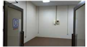
御殿場プレミアム・アウトレットのサイレンスルーム