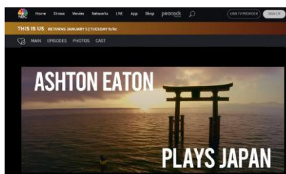
NBC ウェブサイトでのオンライン CM