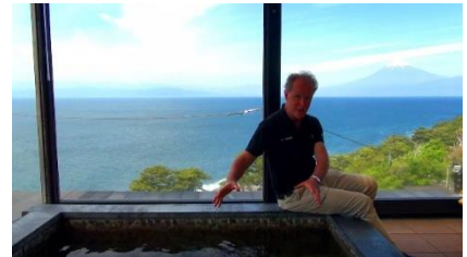
富士山を一望できる高級旅館（静岡県）