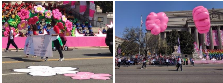
全米桜祭りパレードの様子