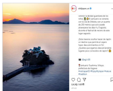
5、6 月におけるオウンドメディアを活用した情報発信