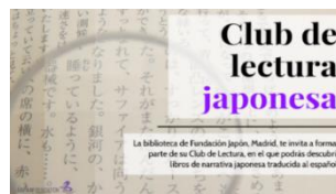
国際交流基金マドリード事務所主催の読書クラブイベント告知