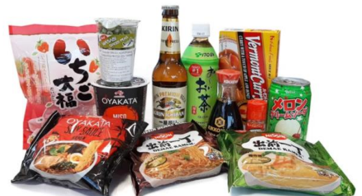
Tokyo-Ya と連携した懸賞キャンペーンの告知