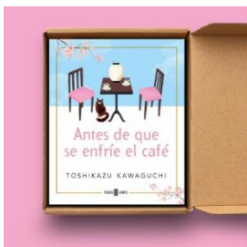
日本を舞台とした小説の単行本懸賞キャンペーンの告知