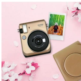
富士フィルム株式会社との懸賞キャンペーン告知