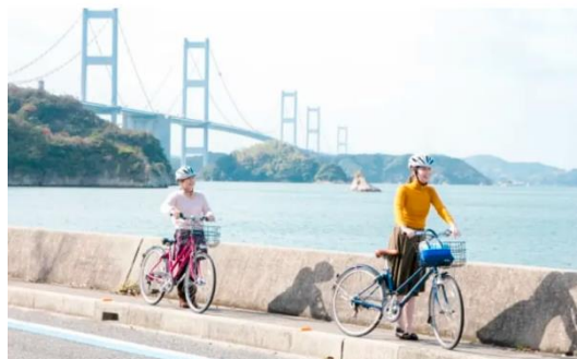
日本の自転車旅や生活文化・美学等のブログ記事を発信