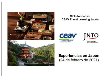
CEAV(スペイン旅行会社連盟)との連携ウェビナーのプレゼンテーション