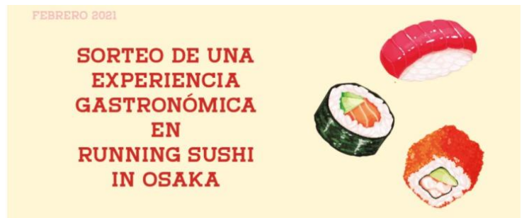
寿司レストランとの懸賞キャンペーン告知