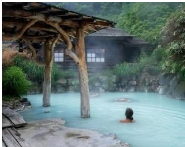
IG 10月リーチ数 5,990 エンゲージメント率 10.1% 秋田県乳頭温泉 @coco.icotto