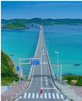
FB 10月リーチ数 35,029 エンゲージメント率 11.6% 山口県豊北町 角島大橋

将来の訪日旅行再開時に向けて、フィリピン市場向け公式 Facebook (以下、FB) 及び Instagram (以下、IG) を通じた情報発信を毎日実施。双方を比較すると、IG はフォロワー自身が撮影場所で被写体となることをイメージできる投稿がより好まれ、FB はより壮大で色鮮やかな風景の投稿がより好まれる傾向がある。