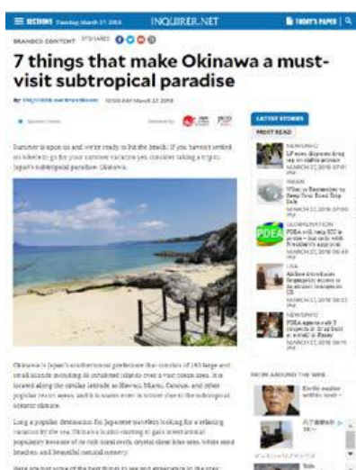
3月27日付掲載 インクワイアラー紙(Inquire.net)