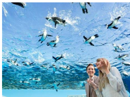
4月12日投稿 池袋の水族館 (サンシャイン水族館)