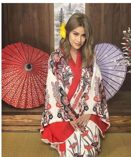
3月17日投稿 いいね 31,304