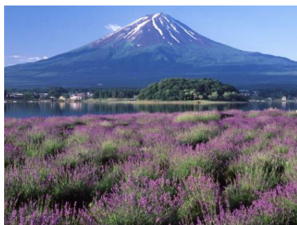
4月30日投稿 富士山とラベンダー