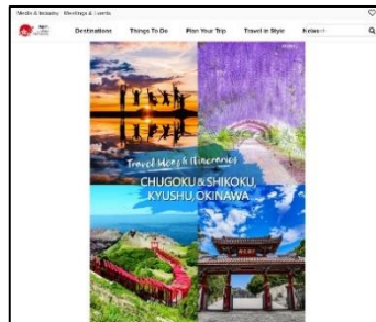
モデルコース・インスタ映えスポット 紹介ページ