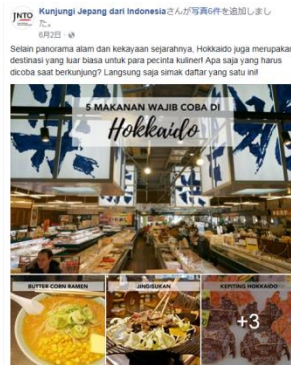
北海道の食の紹介(6 月 2 日)