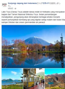
洞爺湖の紹介(6 月 8 日)