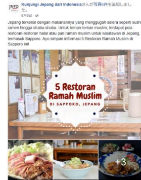
ハラール食の紹介(6 月 6 日)

インドネシア語公式 Facebook サイト https://www.facebook.com/KunjungiJepang