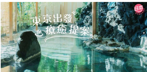
キャンペーンキービジュアル