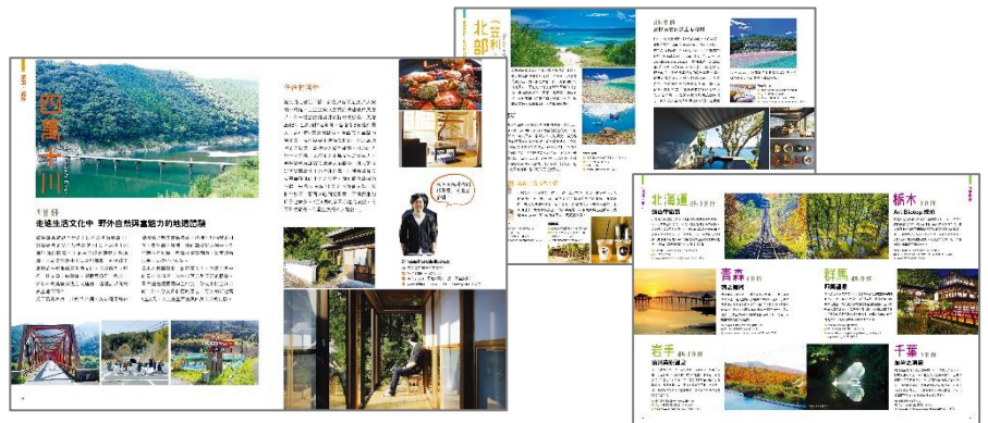
フォトジェニックなスポットや日本人の生活風景を紹介