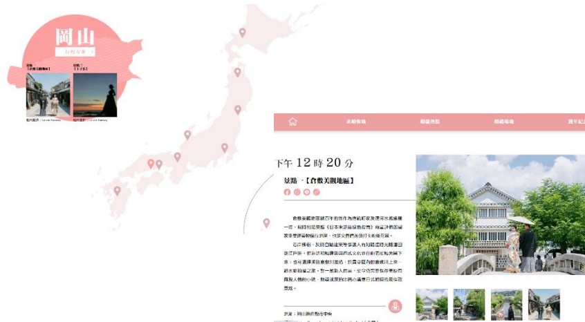
日本各地のフォトウェディングスポットを紹介