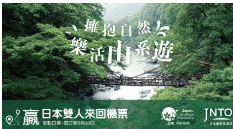
キャンペーンキービジュアル