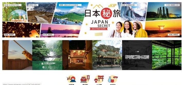
キャンペーンサイトトップ画 (自然景色、歴史、文化、グルメをテーマに情報を発信)