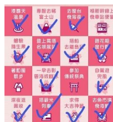
投稿されたビンゴとコメント