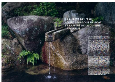
日本食 パンフレット