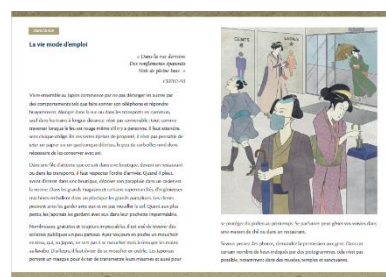
日本の習慣・マナー パンフレット