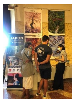
ラヴァルダンス城 Fragments du Japon 日本選展の様子