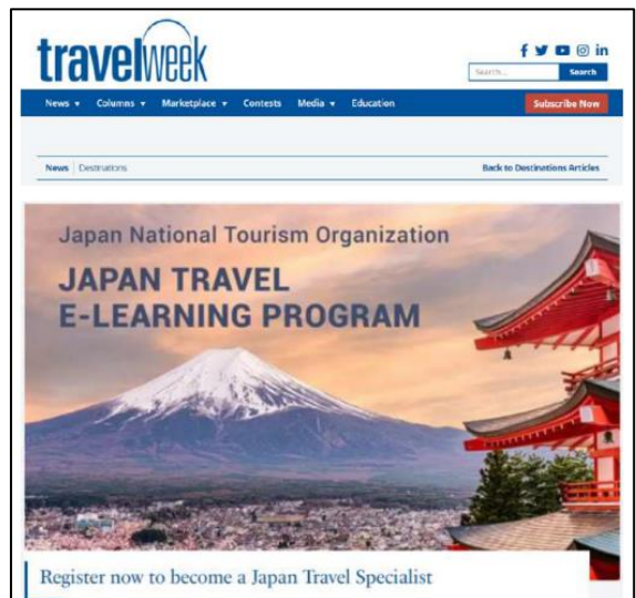
Eラーニング講座広告