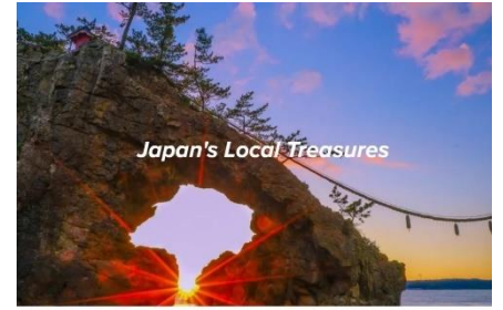
Discover Japan with New treasures

全国のDMOや自治体がお勧めする新しい観光情報を募集し、JNTOグローバルサイトに掲載するとともにJNTO海外事務所のSNSや各訪日プロモーションでも活用しています。掲載コンテンツは、各地方運輸局・各広域連携DMOと調整の上、決定します。