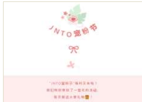
【プレゼントキャンペーン記事】記事にコメントを残したフォロワーを対象に抽選を行い、プレゼントを贈呈