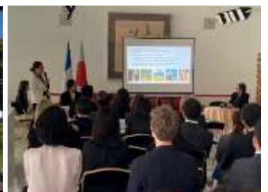
シンポジウム「日仏の未来の観光」