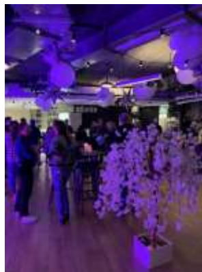
Sno'n'Ski Holidays 主催 セミナー・ネットワーキングイベント