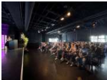
JNTO 職員のセミナーの様子