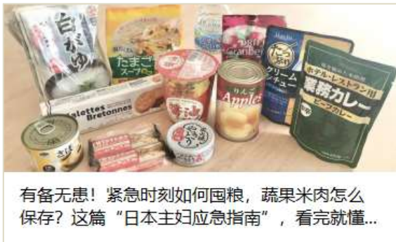
【5 月のトップ記事】お米や野菜の保存方法や長持ちのコツ、備蓄品等を紹介