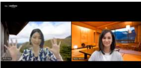
Facebook ライブ配信 (鳥取県三朝町)