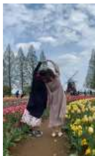
Facebook 1 位投稿(6 月 8 日) リーチ数 4,514 エンゲージメント率 46.37% 千葉県 あげぼの山農業公園

フィリピン市場公式 Facebook ( https://www.facebook.com/visitjapan.ph/ ) (以下 FB) 及び Instagram ( https://www.instagram.com/visitjapanph/ ) (以下 IG) を通じた情報発信を実施している。5 月～6 月においては、IG は動画投稿、FB は母の日やベストフレンドデー等の記念日に合わせた参加型の投稿の人気の高かった。共通して行動喚起(CTA)を促進する投稿のエンゲージメント率が高く、人気の投稿は次のとおり。