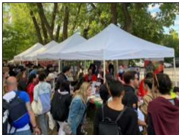
YATAI MTL での JNTO ブースの様