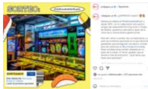
現地回転寿司店と連携したキャンペーン