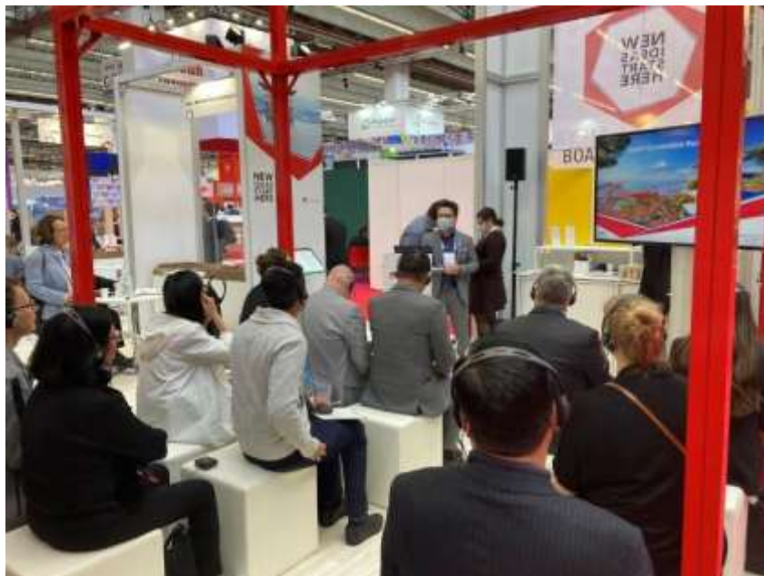
IMEX Frankfurt 2022 における JNTO プレゼンテーションの様子