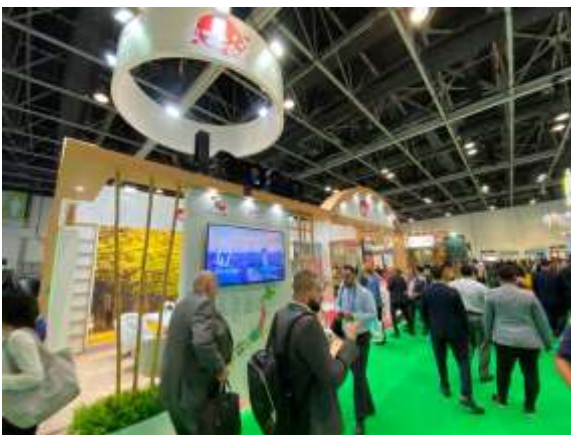
Arabian Travel Market2022 日本ブースの様子