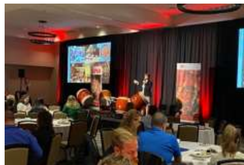
Elevate ランチセミナーの様子