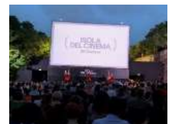
日本映画祭「イゾラ・デル・ジャポネ」での訪日プロモーション