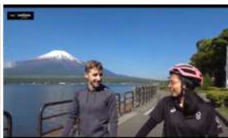
Facebook ライブ配信 (山梨県)