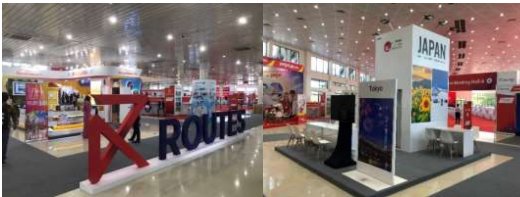
Routes Asia 2022 会場入口