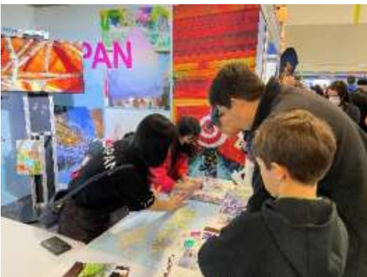
Snow Travel Expo 会場の様子