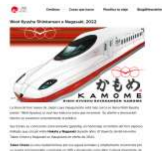
新幹線イヤープロモーションについての情報発信