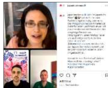
インスタグラムライブの様子