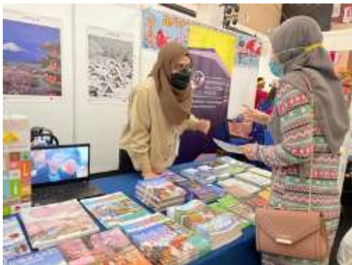
「フェスティバル・クランタン・ジャパン 2022」