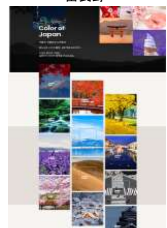
jroute サイト内キャンペーンサイト

https://www.welcometojapan.or.kr/jroute/front/campaign2022