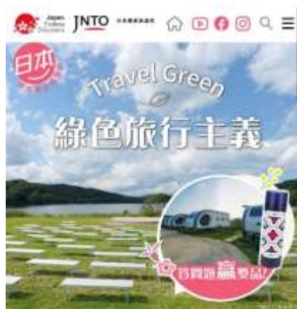
「グリーントラベル」コンテンツの公開