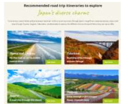
キャンペーン特設サイト