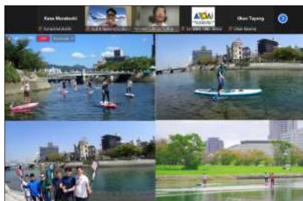
ウェビナーでのアクティビティ紹介