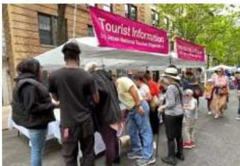
Japan Parade でのブース出展の様子