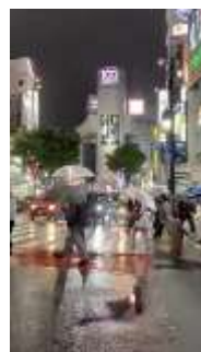
Instagram 1 位投稿(6 月 28 日) リーチ数 6,092 エンゲージメント率 56.45% 東京都渋谷区 @elchomsky