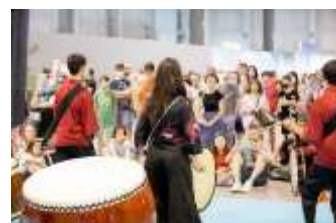
「Japan Show」での VJ ブース出展とイベントの様子