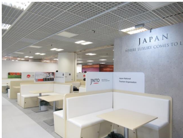
ジャパンパビリオン・共同出展ブース