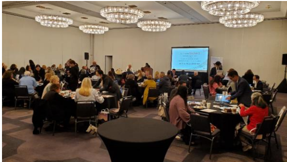
2022年度の商談会の様子（対面）

つきましては以下の通り、サプライヤー参加者を募集いたしますので、ぜひ参加をご検討賜りますようお願い申し上げます。なお、参加枠には限りがございますため、ご希望に添えない場合もございます。予めご了承ください。