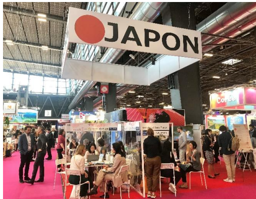
IFTM Top Resa 2022 での様子

については、共同出展者を以下のとおり募集させていただきます。出展する自治体・観光関連団体等の皆様と連携し、官民一体となって、日本の多様な観光の魅力をアピールしてまいります。皆様のご応募をお待ち申し上げております。