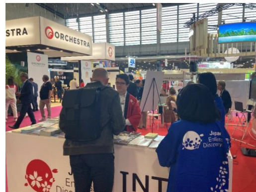
IFTM Top Resa 2022 での様子