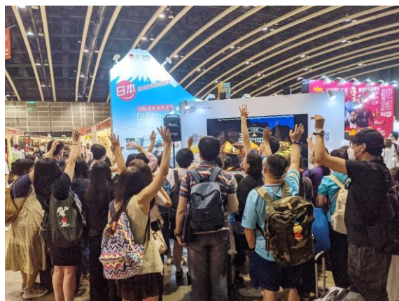
香港ブックフェア 2022 の様子