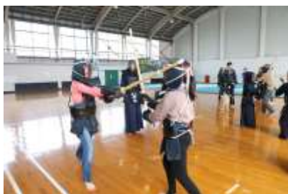
愛荘 -SAMURAI SPIRIT- 剣道のまち