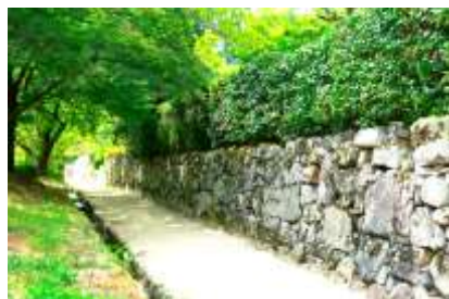
大津 -SAMURAI WALL- 石積みのまち