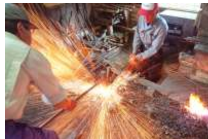
長浜 -SAMURAI SWORD- 鍛冶屋のまち