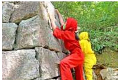
甲賀 -NINJA- 忍者のまち