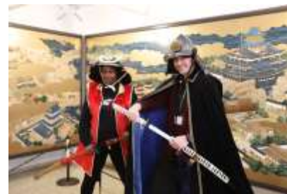
近江八幡 -KING of SAMURAI- 霸王・織田信長のまち