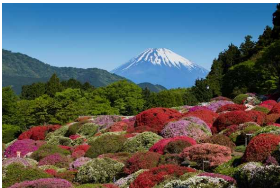
富士山を背景に咲き誇るツツジ

箱根・芦ノ湖畔に建つ“ 小田急 山のホテル ”は 4 月下旬から 「つつじ・しゃくなげフェア 2024」 を開催し、「後世に残すべき植物遺産」と認定を受けた 30 の古品種を含む 84 種類・約 3,000 株のツツジと、42 種類・約 300 株のシャクナゲが開花を迎える庭園をお楽しみいただけます。ここでは壮大な富士山や芦ノ湖をバックに、広大な庭園に色鮮やかなツツジが咲き誇る絢爛たる景色をご覧ください。庭園のツツジは 2022 年に 「日本植物園協会ナショナルコレクション第 10 号」 に認定され、昨年 3 月には、シャクナゲも 「日本植物園協会ナショナルコレクション第 15 号」 に認定されました。今年は、ツツジとシャクナゲがナショナルコレクションに認定されたことと、昨年、ホテルの開業 75 周年を迎えたことを記念して、庭園の歴史なども紹介するツツジ・シャクナゲの小冊子「 小田急 山のホテル 庭園のツツジとシャクナゲ 」を販売いたします。