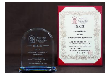
ツツジ認定時の日本植物園協会ナショナルコレクション認定証と認定盾