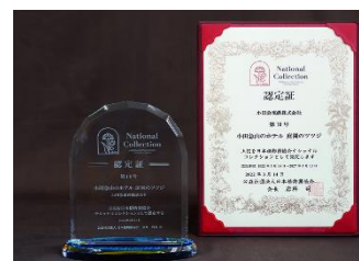
ツツジ認定時の日本植物園協会 ナショナルコレクション認定証と認定盾