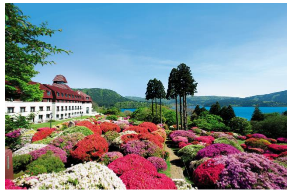
“小田急 山のホテル”のツツジ庭園と芦ノ湖