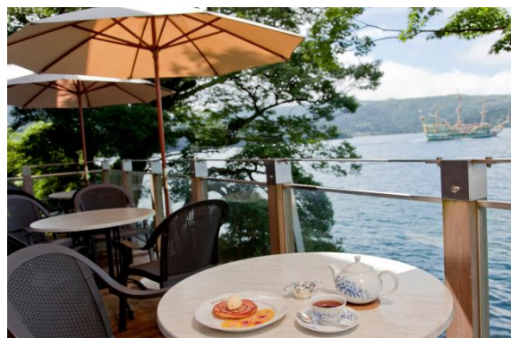
“サロン・ド・テ ロザージュ”のテラス席