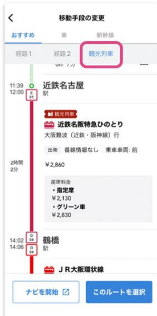
ルート検索結果/移動手段の変更画面