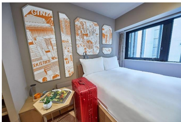
▲部屋タイプ「ビッグベッド」