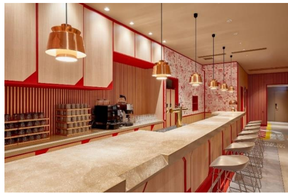
▲Café & Bar「REFUEL+」

lyf Ginza Tokyo 2-5-4 Kyobashi, Chuo-Ku, Tokyo, 104-0031, Japan lyf 銀座東京 〒103-0031 東京都中央区京橋 2-5-4 Email: enquiry.ginza@the-ascott.com @lyf.ginza https://www.instagram.com/lyf.ginza #livelythere