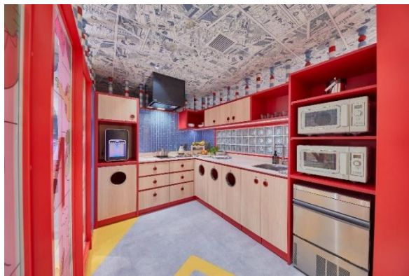
▲ソーシャルキッチン「BOND」