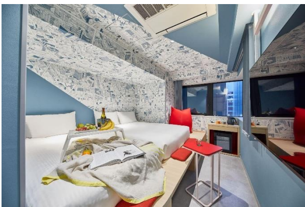
▲部屋タイプ「オールトゥギャザー」