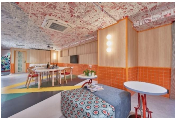
▲コワーキングラウンジ「CONNECT」