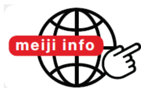
「ブランドリンク」イメージ