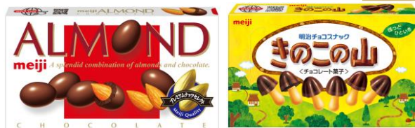
「ブランドリンク」商品掲載イメージ

訪日外国客数はコロナ前と比較して回復傾向にあり、訪日外国客の利用頻度が高い量販店や空港などの土産店での当社売り上げは好調に推移しています。このたび、外国のお客さまに商品情報をより分かりやすく伝えるために多言語対応情報サイトを開設します。多言語対応情報サイトは、日本の和のイメージを想起させるようなデザインとし、外国のお客さまに日本の菓子の魅力を知っていただけるような構成としました。パソコンやスマートフォンから、いつでも誰でも簡単に当社菓子商品の特長、アレルギー情報を5カ国語で表示できます。また、多言語対応情報サイトに遷移する二次元コードと、商品情報検索マーク「ブランドリンク」を2023年11月より当社菓子商品のパッケージに順次対応し、今後は100品以上に展開します。これにより、外国のお客さま自身で商品情報を検索いただき、理解していただくことで、当社商品の認知拡大や高まるインバウンド需要への取り組み強化を図ります。