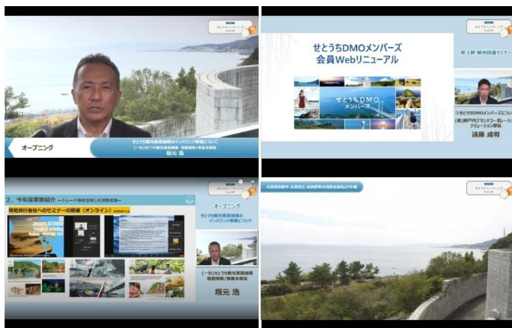
<前回のせとうちミーティング・オンライン開催の様子>

せとうちDMO（※1）は、「第13回せとうちミーティング from 山口」を2023年11月9日（木）にオンラインで開催いたします。