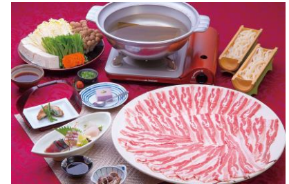
黒豚しゃぶしゃぶ