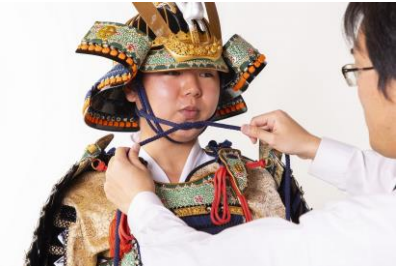
甲冑体験 イメージ