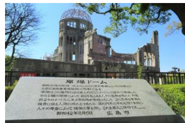
広島平和記念公園の原爆ドーム

瀬戸内エリアは、米国のニューヨーク・タイムズ(The New York Times)が発表した「2019 年行くべき 52 ヶ所」の中で、日本で唯一、「瀬戸内の島々(Setouchi Islands)」として 7 位に選ばれています。海外から個人で手配するのは難しいエリアですが、本ツアーでは通訳ガイドがご案内いたしますので、魅力あふれる瀬戸内エリアを存分に堪能していただけます。また同じく訪日外国人から人気が高く、2023 年 5 月の G7 広島サミット開催地としても話題の広島や、宮島も巡ります。