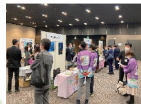
過去開催時の様子

都内の観光関連団体等が出展し、地域の魅力や観光取組事例等を紹介し、今年度は本イベント初の試みとして、ステージや映像を使った各地域のPRや、特産品の試飲・試食会等を行います。