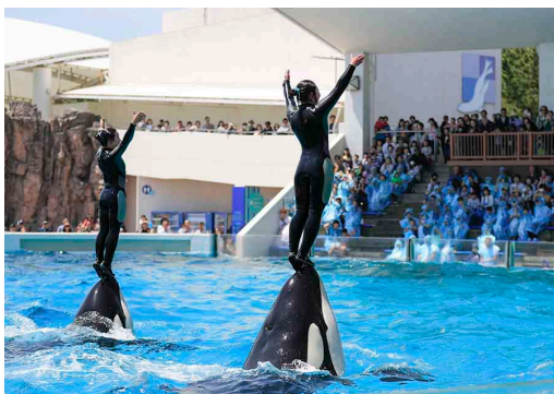
シャチパフォーマンス Killer Whale Performance