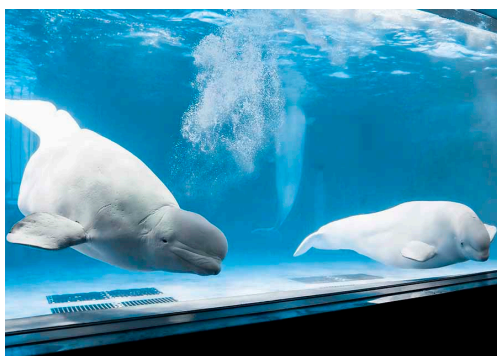
ベルーガパフォーマンス Beluga Performance