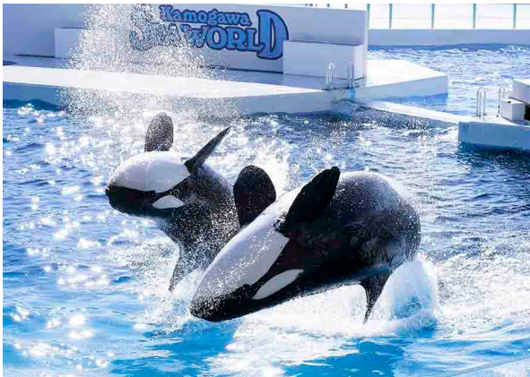
シャチパフォーマンス Killer whales performing

https://www.kamogawa-seaworld.jp/event/event_info/8886/