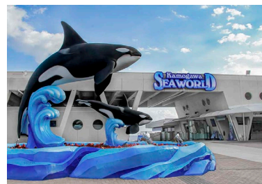
メインゲート Main Gate