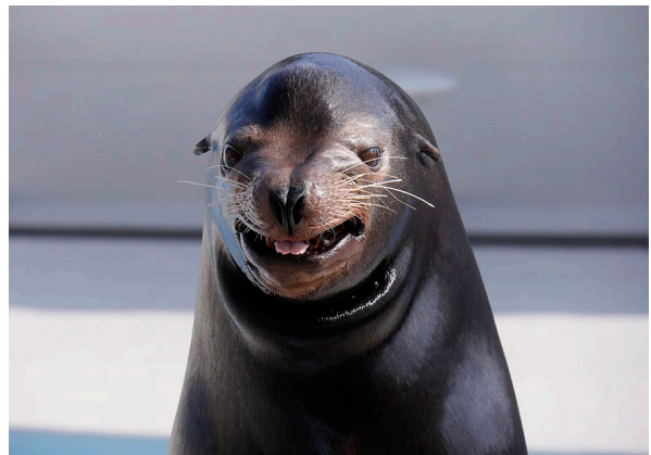
笑うアシカ Smiling sea lion

株式会社グランビスタ ホテル&リゾート（本社：東京都千代田区、代表取締役社長：須田貞則）の基幹施設である鴨川シーワールド（千葉県鴨川市、館長：勝俣浩）では、2023年の1月10日（火）～2月28日（火）の期間中、日本国以外のパスポート提示で、入館料金が半額となる「ウェルカムビジターキャンペーン」を開催します。