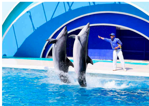
イルカパフォーマンス Dolphin Performance