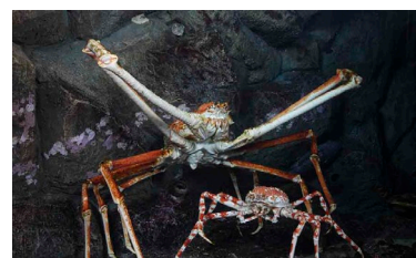
タカアシガニ Japanese spider crab

*Ages 3 and below can enter free of admission