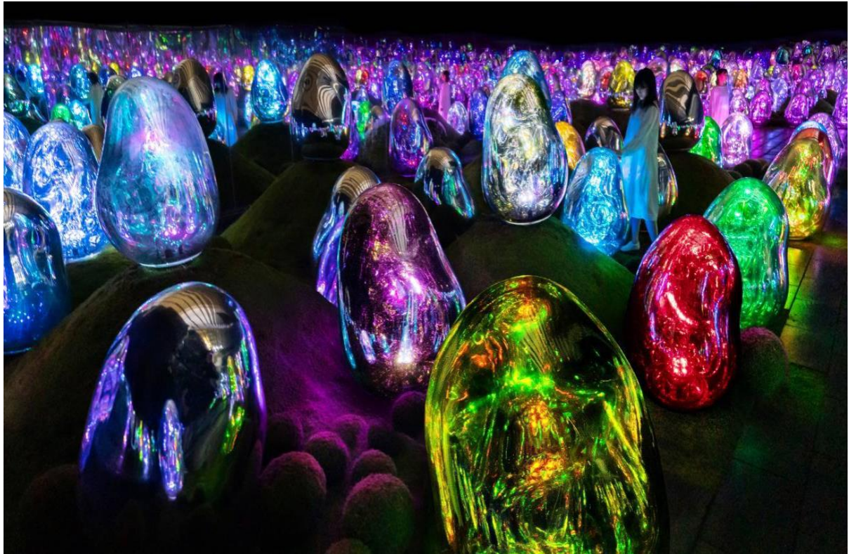
teamLab, Moss Garden of Resonating Microcosms - Solidified Light Color, Sunrise and Sunset© teamLab

作品: https://planets.teamlab.art/tokyo/jp/ew/resonating_microcosms_mossgarden_planets/