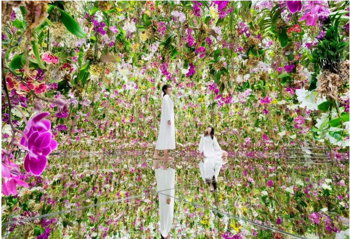
teamLab, Floating Flower Garden: Flowers and I are of the Same Root, the Garden and I are One © teamLab

作品: https://planets.teamlab.art/tokyo/jp/ew/ffgarden_planets/