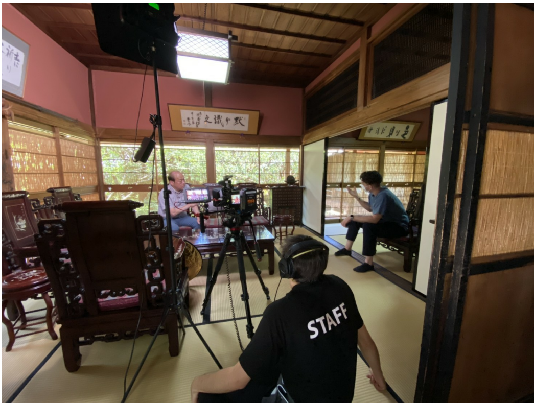
薩摩焼15代沈壽官のインタビュー風景