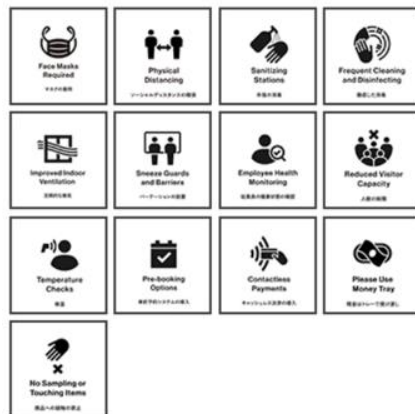
ピクトグラム（日英併記版）