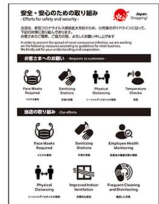
店舗入口での表示例

2020年オリンピック・パラリンピック大会に向けた多言語対応協議会小売プロジェクトチーム（以下「小売PT」という。）は、訪日ゲストに安全・安心にお買い物を楽しんでもらうために「安全・安心のための取り組み表示」を公開いたしました。