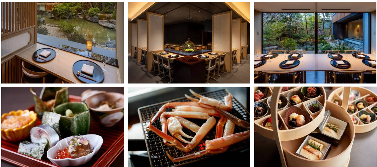
レストラン 庵都（いほと）

さらに、館内には、コンシェルジュデスクがございますので、料亭やレストラン、京都観光のより細かな情報についてご相談いただくことが可能です。