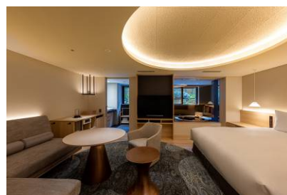
Stylish Suite Double