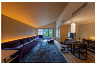
FUFU Luxury Premium Suite