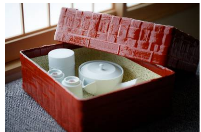
ふふ 京都 客室