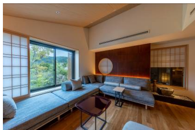
FUFU Luxury Suite