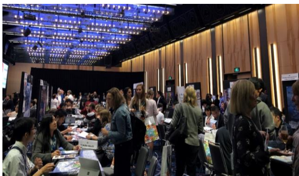
Japan Roadshow2019 シドニー会場の様子

JNTO シドニー事務所では、ビジット・ジャパン (VJ) 事業の一環として、豪州の現地旅行会社等を対象とした訪日旅行商談会「Japan Roadshow 2022」を開催します。つきましては参加者の募集についてご案内しますので、ぜひ積極的にご参加をご検討ください。(※5月20日付けで参加希望調査を行った、豪州「Japan Roadshow 2022」(訪日旅行商談会)の正式募集です。)